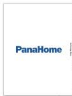
テクノロジーブック