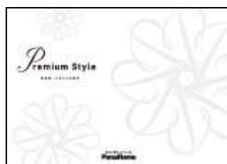
⑦ こだわりの邸宅 「Premium Style」 実例集