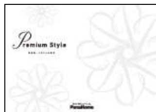
⑦ こだわりの邸宅 「Premium Style」 実例集