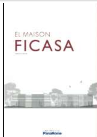
④ 先進の賃貸住宅 「フィカーサ」