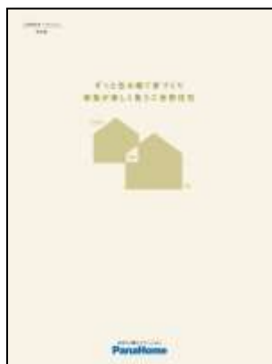
⑤ 二世帯住宅「つどいえ」 実例集