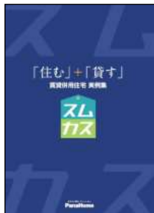
⑥ 賃貸併用住宅「スムカス」 実例集