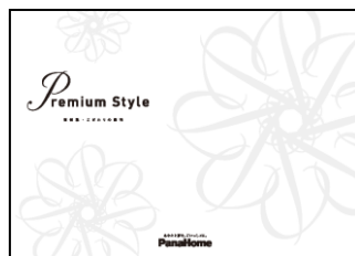
⑦ こだわりの邸宅 「Premium Style」 実例集