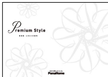
⑦ こだわりの邸宅 「Premium Style」 実例集