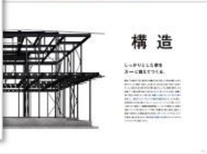
「生きる家。」 コンセプトシート付！