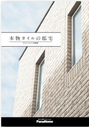
⑤ きれいが続く邸宅 「本物のタイル邸宅」 実例集