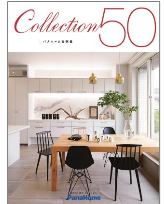
⑧ 実例集 『コレクション50』