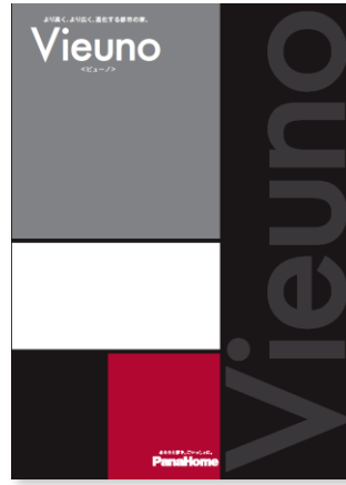
③ 業界初9階建! 進化する重量鉄骨の家 「ビューノ」