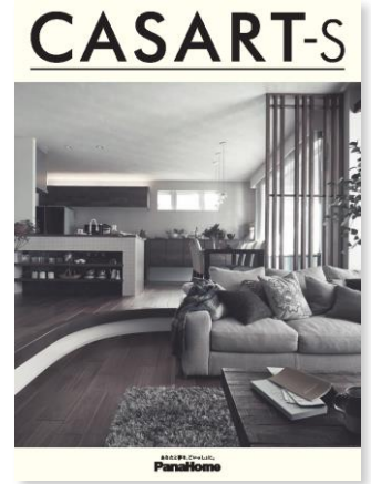
④ 暮らし心地を自由に デザインする制震鉄骨の家 「カサート-S」