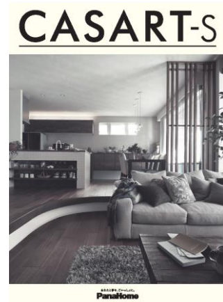
④ 暮らし心地を自由に デザインする制震鉄骨の家 「カサート-S」