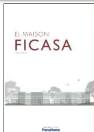
④ 先進の賃貸住宅 「フィカーサ」