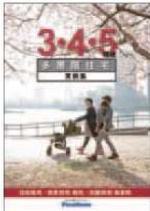
⑥ 「3・4・5階建多層階住宅」 実例集