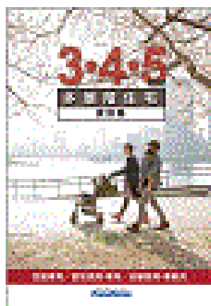
⑦ 3・4・5階建 実例集