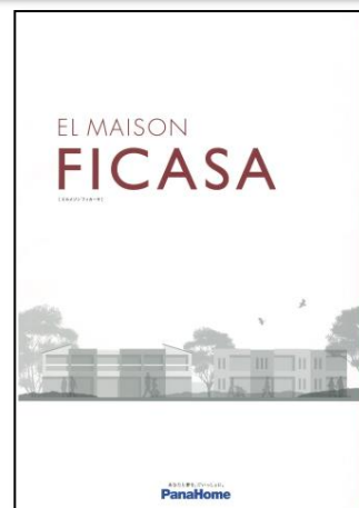
④ 先進の賃貸住宅 「フィカーサ」