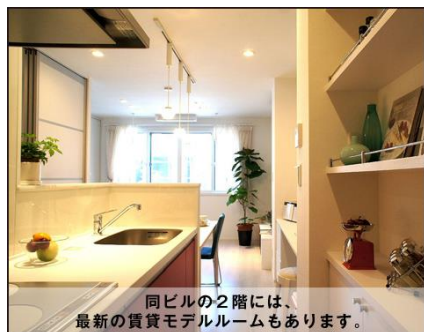
同ビルの2階には、最新の賃貸モデルルームもあります。

後援 一般財団法人 住宅生産振興財団 昭和54年に住宅の質、住環境の質の向上に取り組むことを目的に設立された一般財団法人です。 実績：全国421か所で18,441棟の戸建住宅を供給(平成25年度末実績) 東京都が推進している木密地域不燃化10年プロジェクトに協力しています。