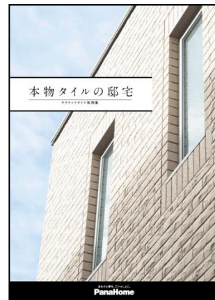
⑧ 本物タイルの邸宅 キラテックタイル実例集