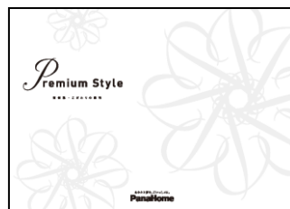
⑦ こだわりの邸宅 「Premium Style」 実例集