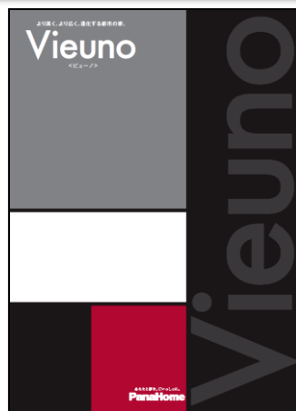
③ より高く、より広く。 進化する重量鉄骨の家 「ビューノ」