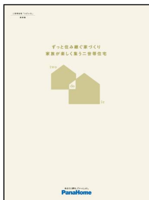
⑤ 二世帯住宅「つどいえ」 実例集