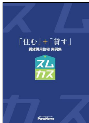
⑥ 賃貸併用住宅「スムカス」 実例集