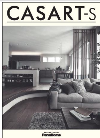
② 暮らし心地を自由にデザイン する制震鉄骨の家 「カサート-S」