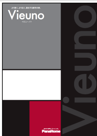
③ より高く、より広く。 進化する重量鉄骨の家 「ビューノ」