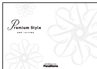
⑦ こだわりの邸宅 「Premium Style」 実例集