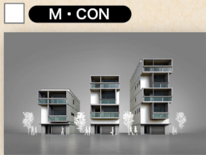
耐火 RC 住宅 (3~5F)