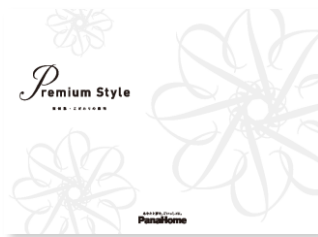
⑦ こだわりの邸宅 「Premium Style」 実例集