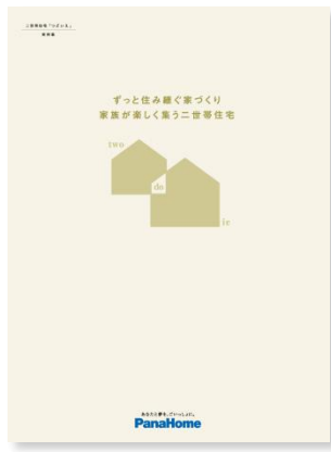
⑤ 二世帯住宅「つどいえ」 実例集