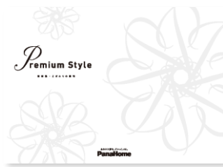
⑦ こだわりの邸宅 「Premium Style」 実例集