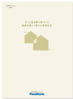
⑤ 二世帯住宅「つどいえ」 実例集