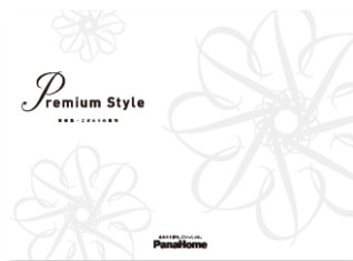
⑦ こだわりの邸宅 「Premium Style」 実例集