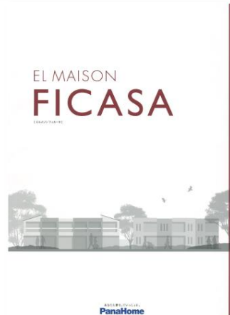
④ 先進の賃貸住宅 「フィカーサ」